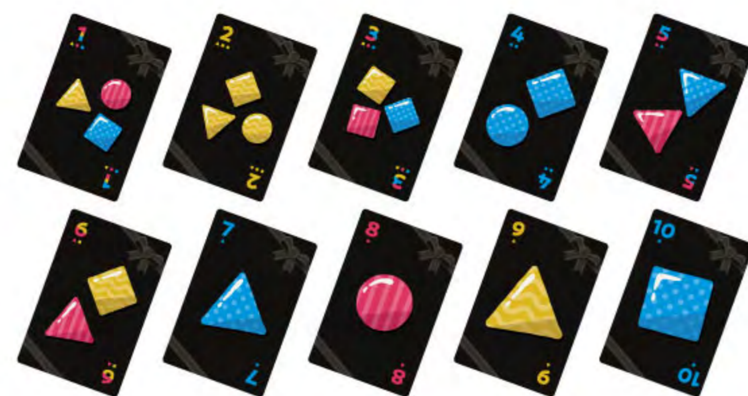
ボンボンカード 78枚