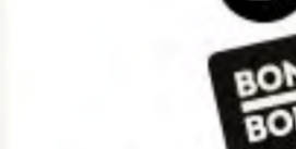
スタートマーカー