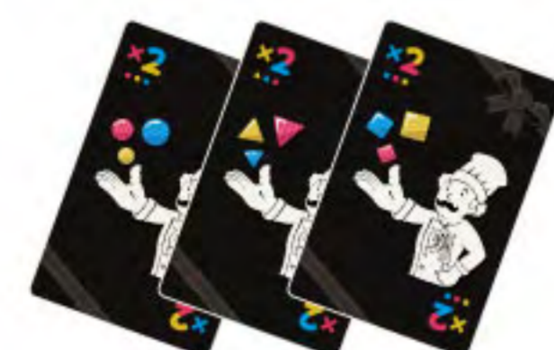
.....パティシエカード 3枚